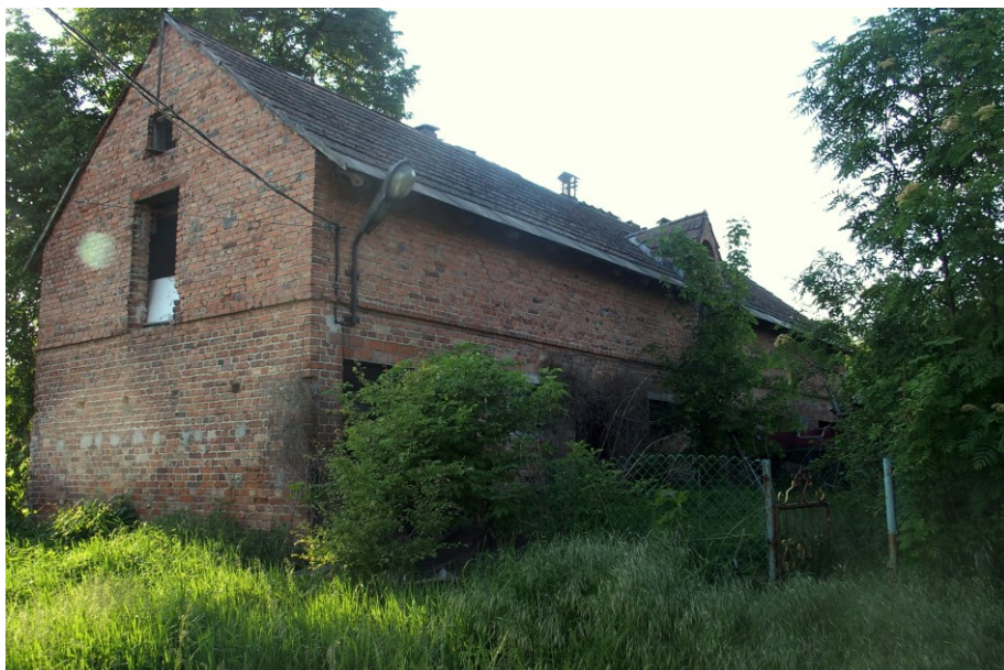
Widok budynku od południowego-wschodu

7. Fotografia z opisem wskazującym orientację w stosunku do sąsiednich terenów lub stron świata albo mapa z zaznaczonym stanowiskiem archeologicznym