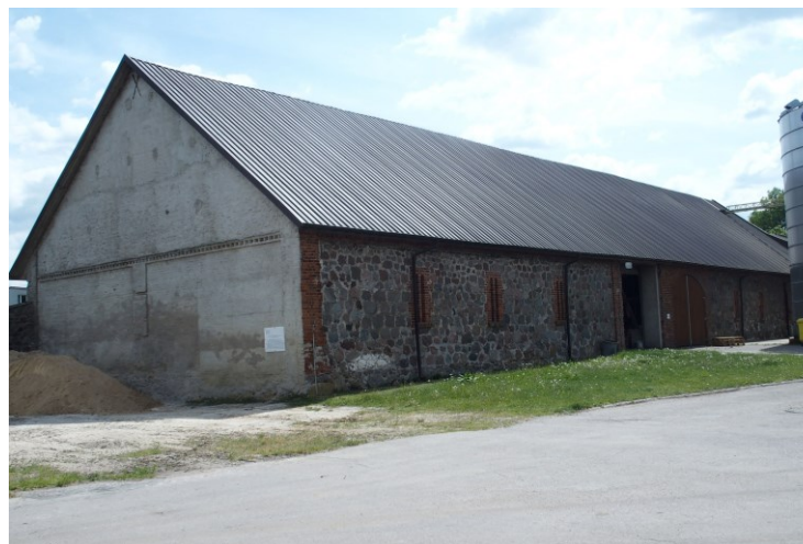
Widok budynku stodoły od północnego-zachodu