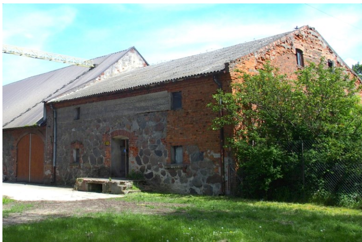
Widok budynku spichlerza od południowego-zachodu

7. Fotografia z opisem wskazującym orientację w stosunku do sąsiednich terenów lub stron świata albo mapa z zaznaczonym stanowiskiem archeologicznym