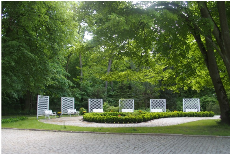
Widok od północnego-wschodu

7. Fotografia z opisem wskazującym orientację w stosunku do sąsiednich terenów lub stron świata albo mapa z zaznaczonym stanowiskiem archeologicznym