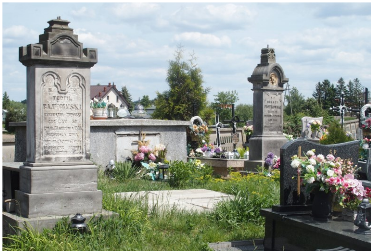
Widok od południowego-wschodu

przy ul. Płocka nr działki ew. 373 obręb Proboszczewice Stare 09-412 Stare Proboszczewice