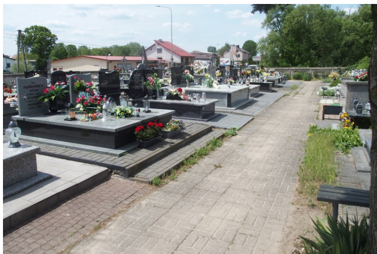
Widok od północnego-wschodu