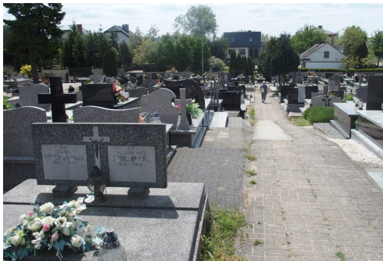
Widok od północnego-wschodu